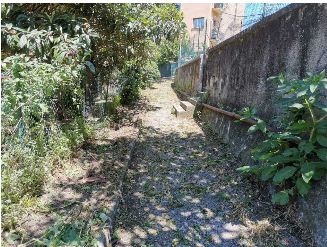
Giardini Varesano: dopo lo sfalcio