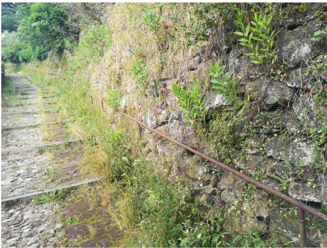
Lo stato della creuza ieri mattina, sabato 20 giugno, al nostro arrivo