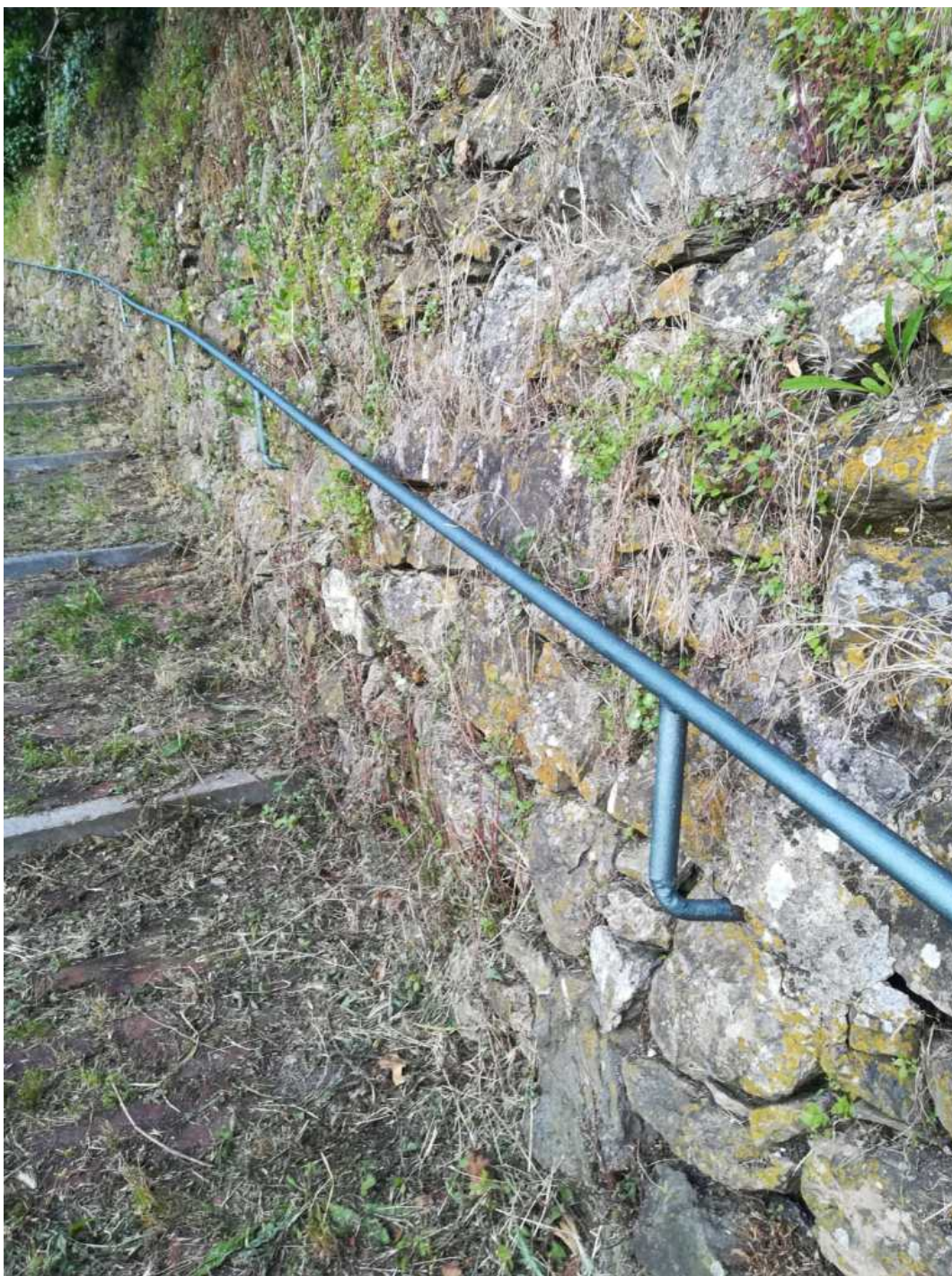
la ringhiera verniciata e di nuovo fruibile al termine dell'intervento!