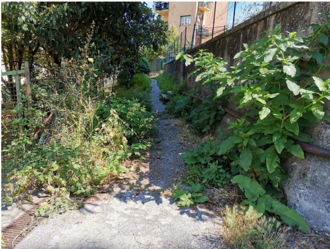
Giardini Varesano: prima dello sfalcio