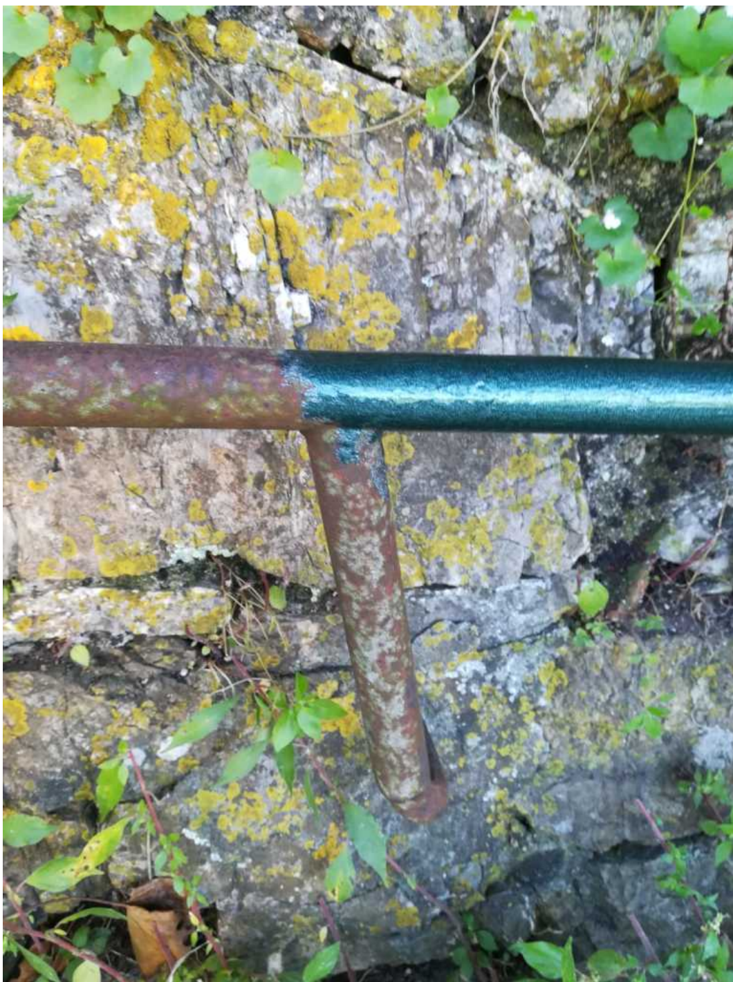
Il bel verde utilizzato per la verniciatura della ringhiera scorrimano