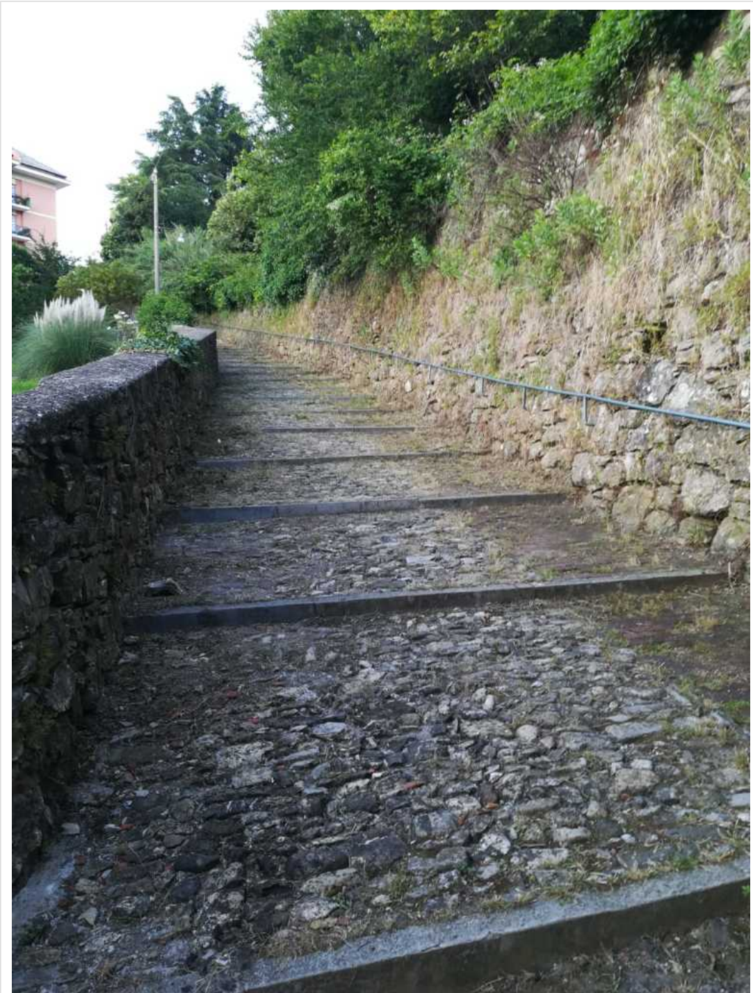
il lavoro finito!!