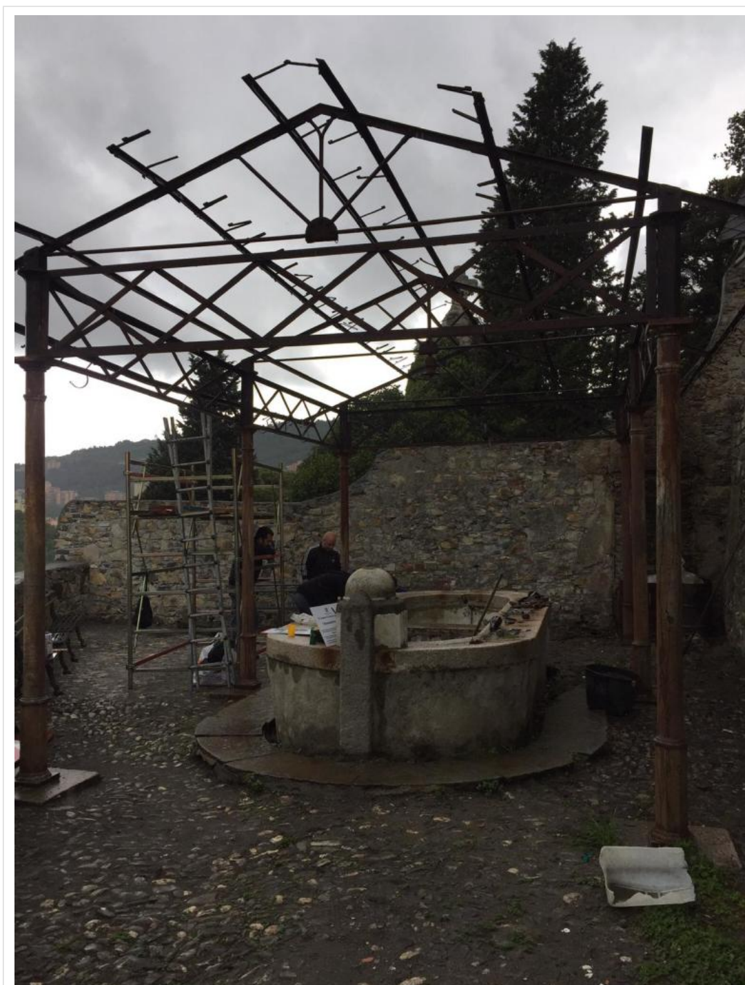
i lavatoi di Staglieno: ora sono infestati da erba alta e rovi, sabato 7 marzo procederemo alla pulizia dell'area

Per quanto riguarda la nostra associazione l'appuntamento è tra le 8:30 e le 9:00 sul sagrato della chiesa di San Bartolomeo di Staglieno (raggiungibile in auto percorrendo via delle Gavette o a piedi risalendo Salita alla Chiesa di Staglieno, dietro la Socrem). La giornata di pulizia procederà fino al primo pomeriggio presso l'area del trogolo di Staglieno (proprio sotto la chiesa di San Bartolomeo). Le operazioni di pulizia consisteranno soprattutto nel taglio di infestanti e rovi nell'area.