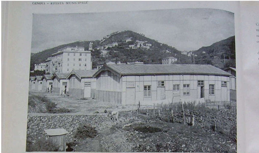
Casa rifugio a Ponte Carrega

Si tratta delle cosiddette "baracche" di Ponte Carrega, costruite nel 1928 per, come si legge nell'articolo, gli sfrattati: